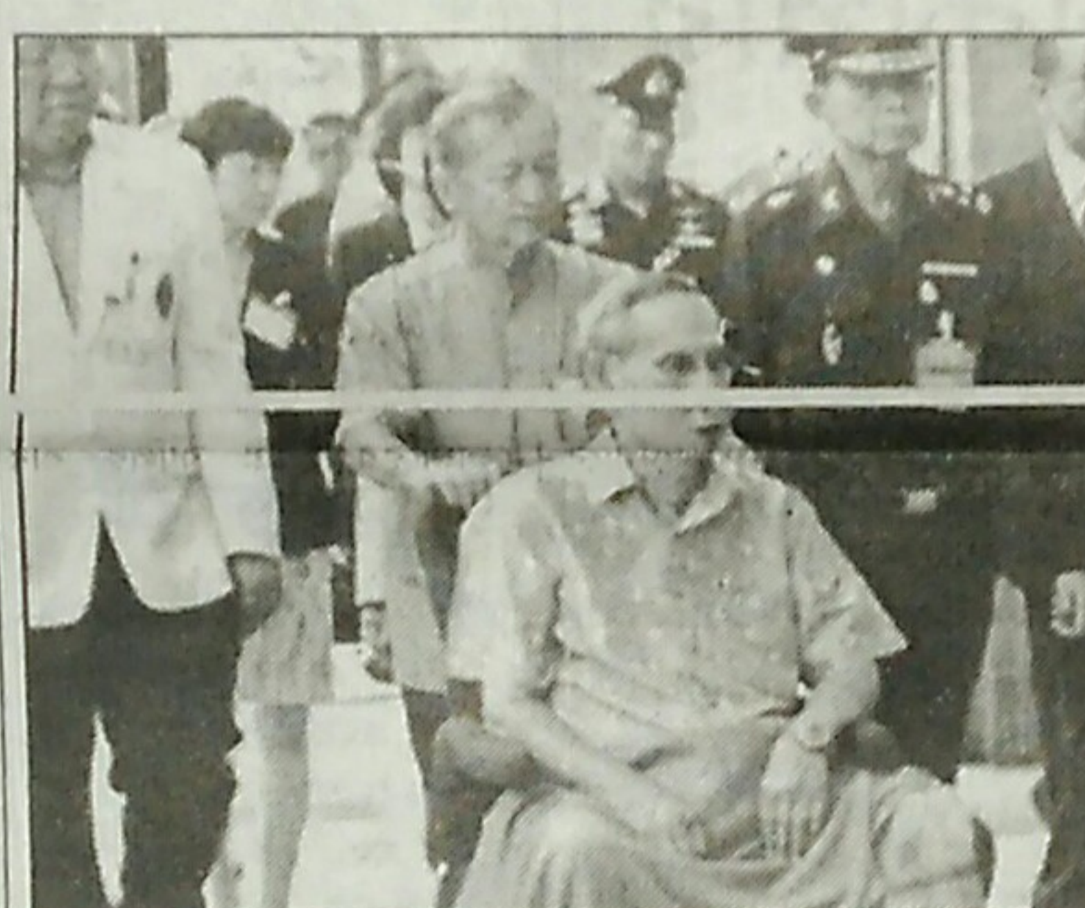
থাইল্যান্ডের প্রয়াত রাজা ভূমিবল আদুল্লিয়াহের